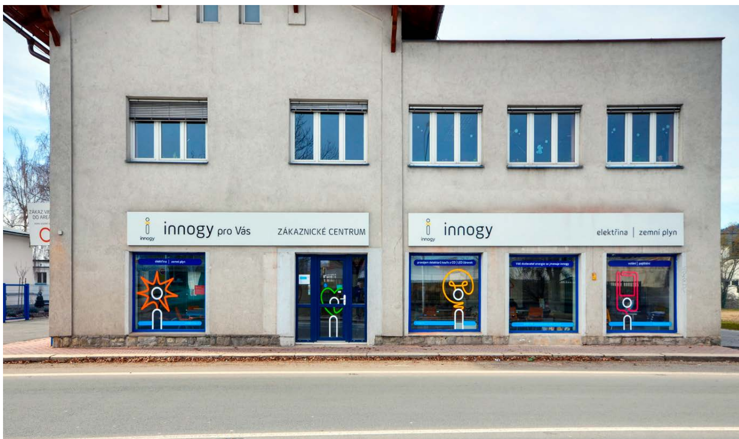
obr. 2 Pohled na pobočku