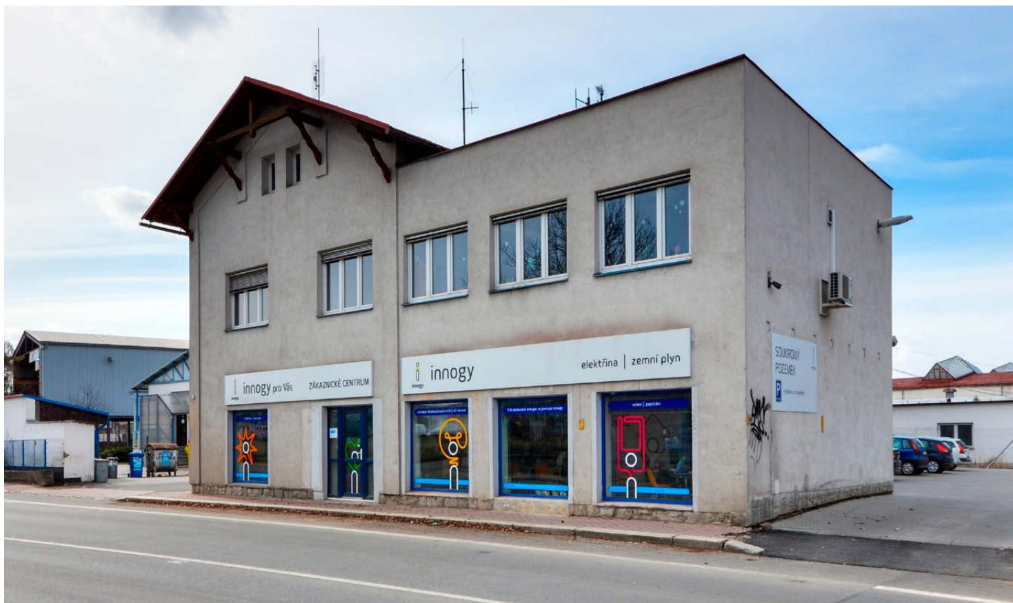
obr. 1 Pohled na pobočku